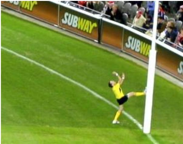
Remise en jeu par un arbitre

Comme son nom l'indique, ce sport est originaire d'Australie. C'est le seul pays possédant une ligue professionnelle nommée l'Australian Football League.