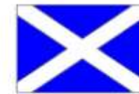
croix de Saint André Ecosse