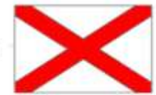
croix de Saint Patrick Irlande du Nord