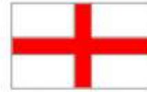
croix de Saint George Angleterre